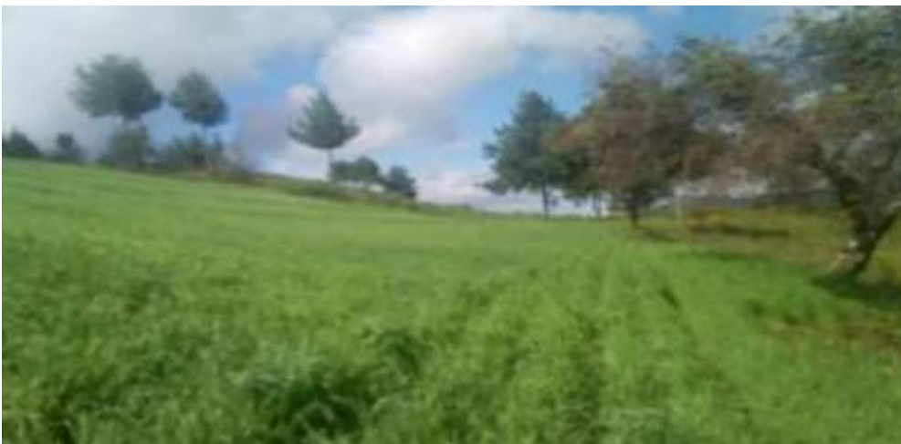
FOTO NR.6: WEIZENFELD DER KIRCHENGEMEINDE

Da die Regierung das Thema Landwirtschaft fördert, hat sie mit dem Anbau eines weiteren strategischen Getreides begonnen, nämlich Weizen. Die Regierung hat Weizensaatgut an Landwirte, Schulen und religiöse Einrichtungen verteilt, darunter auch an unsere Gemeinde, die 100 kg Saatgut für ein Hektar erhalten hat, um die Produktion und Verfügbarkeit von Weizen zu erhöhen, der durch den Krieg zwischen Russland und der Ukraine beeinträchtigt wurde.