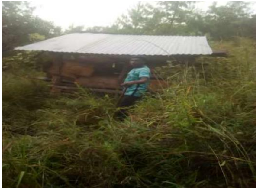
FOTO NR. 5: GEMEINDEMITGLIEDSBIENENSTOCK IN DER HÜTTE, ZWISCHEN BÄUMEN

Zunächst war dieses Projekt unter der Kirchengemeinde. Nun hat die Kirchengemeinde Kapazitäten für die Gemeindemitglieder aufgebaut, damit sie Bienen halten und Honig produzieren können. Die Herausforderungen, die damit verbunden sind, werden gelöst, damit die Gemeindemitglieder ihre Talente im Bereich Bienenhaltung zeigen können.